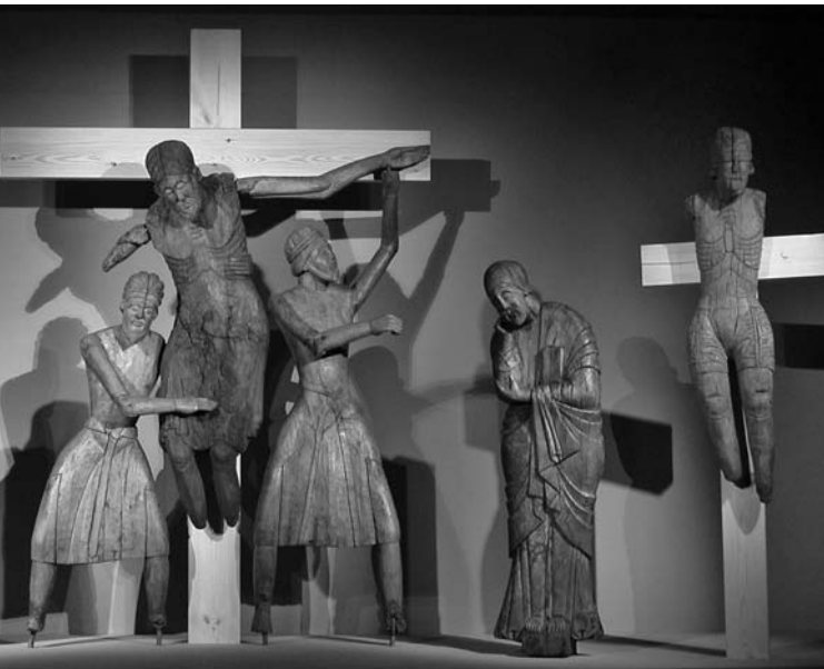
Grup de talles del Davallament d'Erill la Vall Museu Episcopal de Vic, Museu Nacional (Maria i sant Joan)

(Moralejo Álvarez 2004, p. 134-135; Miguélez Caveró 2012, p. 78). Així, en l'àmbit francès es pot destacar el timpà de l'església de Saint-Aventin-de-Laroubost (Haute Garonne, Midi-Pyrénées) i a la península Ibèrica es pot resseguir cap enrere fins, com a mínim el segle x, que van ser representats els quatre evangelistes en la seva forma humana i amb ales a l'anomenada Bíblia de 920 (Lleó, Arxiu de la catedral, Còdex 6, fol. 202, 209, 211 i 214).