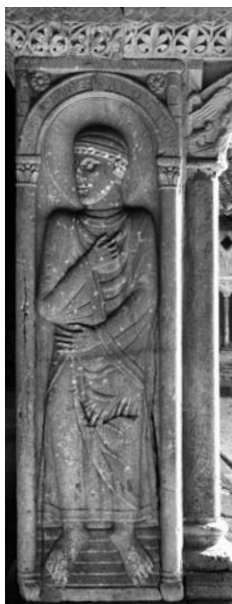
Figura de sant Joan. Moissac Abadia de Saint-Pierre. Claustre

àmbits significatius. Per una banda, la postura del dit índex va esdevenir un atribut de personatges poderosos. És el cas de monarques bíblics, emperadors i reis medievals, que van ser representats habitualment amb el dit índex apuntant cap a dalt en senyal d'autoritat i comandament. Per altra, va ser també la postura que, de manera progressiva, van assimilar un conjunt de personatges dels quals era necessari remarcar la condició d'oradors i/o transmissors d'algun tipus de saber o coneixement, entre els quals hi havia els profetes, apòstols, sants, personatges divins o angèlics.