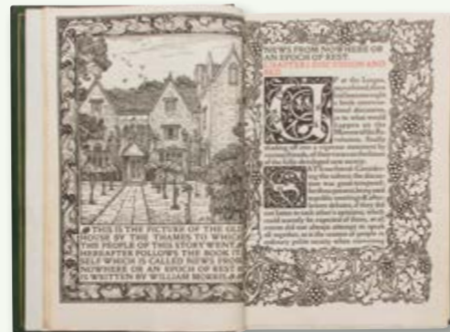
William Morris. News from Nowhere (Notícies d'enlloc) (ed. Hammersmith: Kelmscott Press). 1892