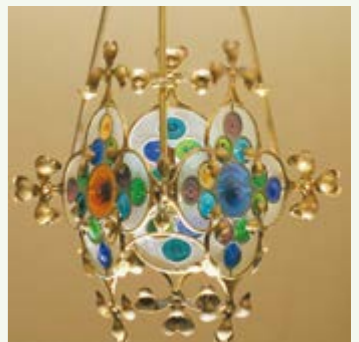
Josep Puig i Cadafalch. Llum de sostre amb decoració floral . Detall, cap a 1900 Museu Nacional d'Art de Catalunya. Dipòsit de l'Institut Amatller d'Art Hispànic, 1970