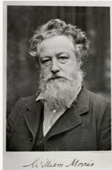
Retrat de William Morris. Fotografia de publicació desconeguda, reproducció del fotogravat de Walker & Boutall, Ph. Soc. Londres, 1909 (sobre fotografia feta cap a 1887). Arxiu del Museo Nacional de Artes Decorativas, Madrid (negatiu sobre vidre FD11978)

ESTA EXPOSICIÓN SE HA PODIDO VER EN LA FUNDACIÓN JUAN MARCH DE MADRID DEL 6 DE OCTUBRE DE 2017 AL 21 DE ENERO DE 2018.