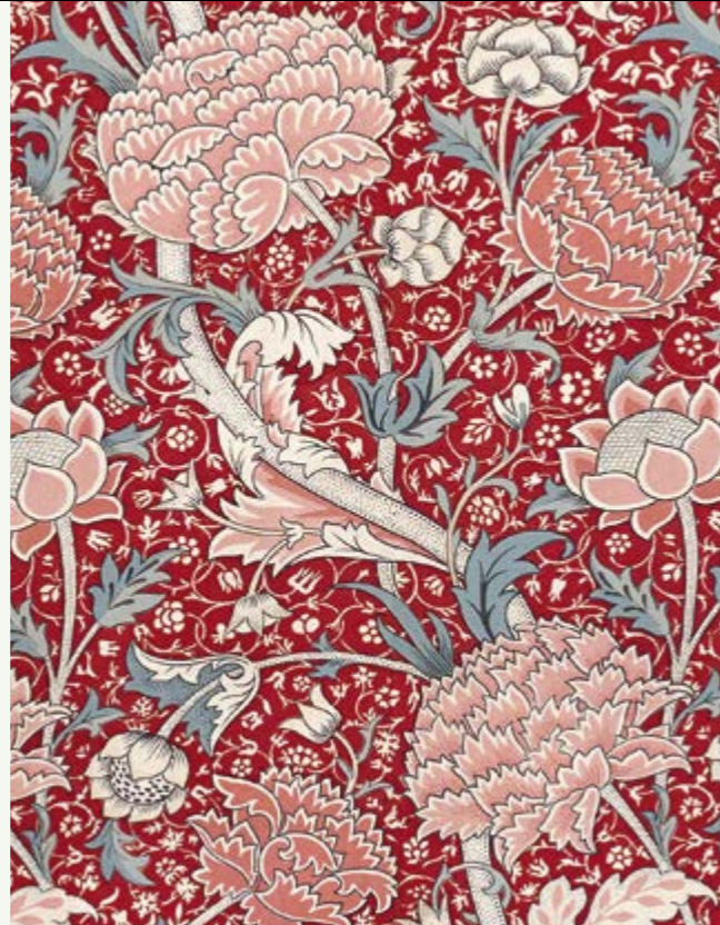
William Morris per a Morris & Co. Draperia «Cray», 1884

AQUESTA EXPOSICIÓ S'HA POGUT VEURE A LA FUNDACIÓN JUAN MARCH DE MADRID DEL 6 D'OCTUBRE DE 2017 AL 21 DE GENER DE 2018.