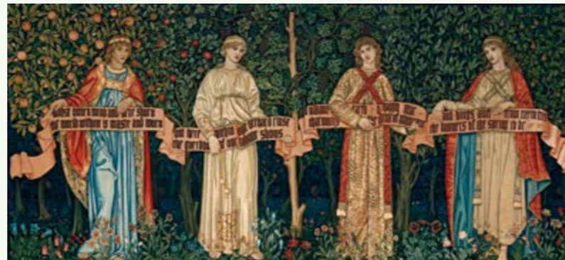
William Morris, John Henry Dearle, Morris & Co., Merton Abbey Workshop. The Orchard (o The Seasons) ( L'hort d'arbres fruiters o Les estacions). 1890