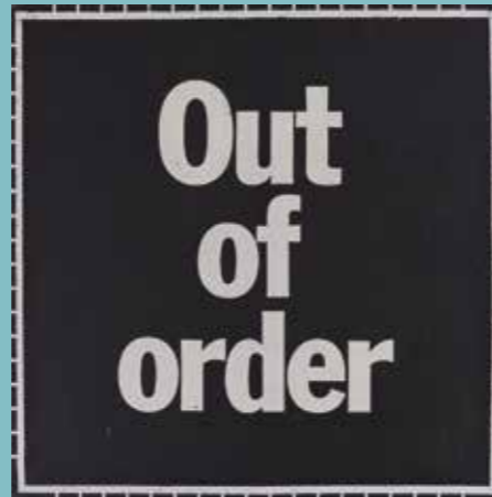
Joan Rabascall. Out of order , 1971 Gentilesa de Palmadotze Galeria d'Art © Joan Rabascall, VEGAP, Barcelona, 2018