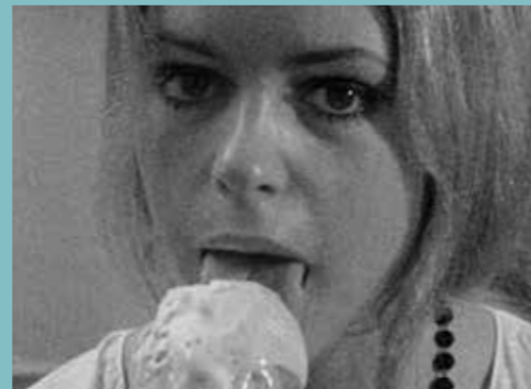
Antoni Padrós. Ice Cream , 1970. Filmoteca de Catalunya