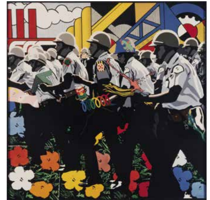
Equipo Crónica. Pim-Pam-Pop , 1971. Col·lecció Rafael Tous © Equipo Crónica -drets de coautor Manolo Valdés, VEGAP, Barcelona, 2018