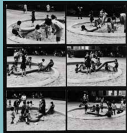
Àngels Ribé. Acció al parc , 1969 Col·lecció de l'artista