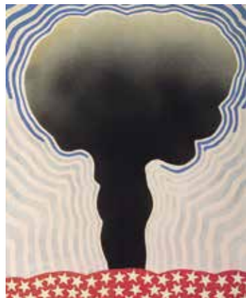
Robert Llimós Bomba atòmica , 1966 Col·lecció hotel medium romàntic © Robert Llimós, VEGAP, Barcelona, 2018

¡Bienvenidos a Liberxina ! ¡Bienvenidos a la revolución!