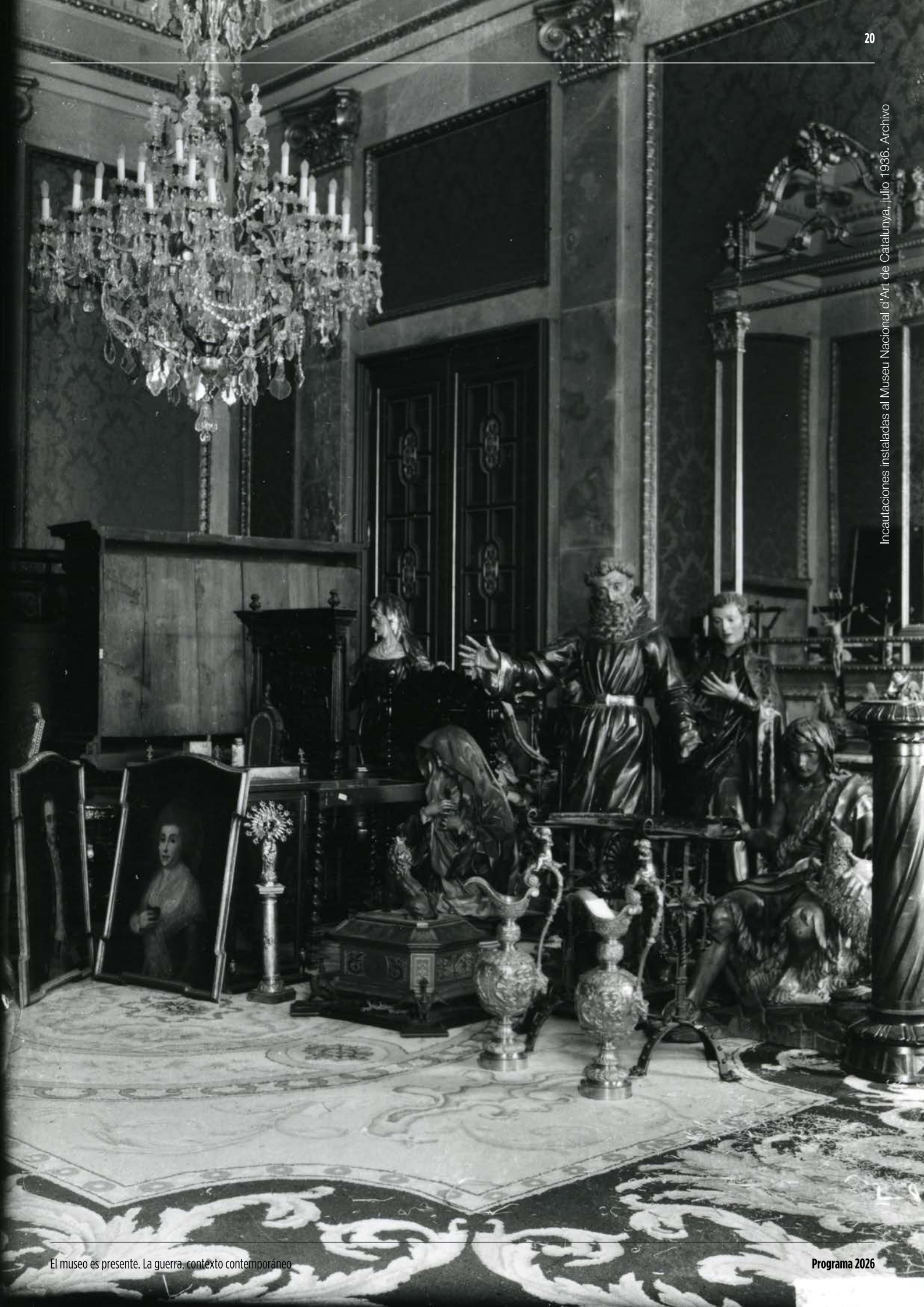
Incautaciones instaladas al Museu Nacional d'Art de Catalunya, julio 1936.