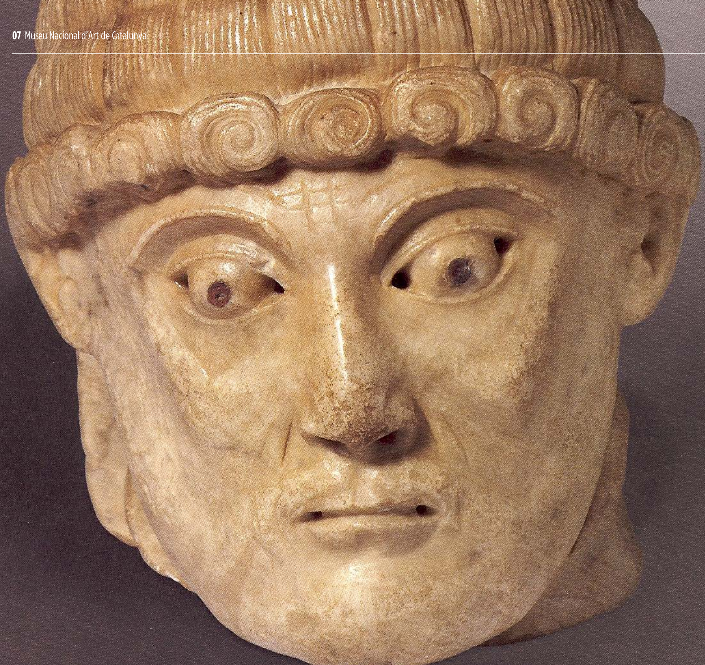
Maestro de Cabestany, Cabeza de san Pedro procedente de Sant Pere de Rodés. Museo del Castillo de Peralada.