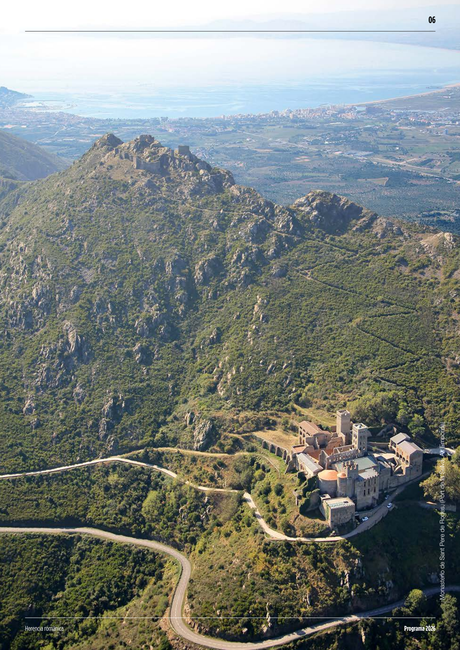
Monasterio de Sant Pere de Rodés, (Port de la Selva, Alt Empordà)