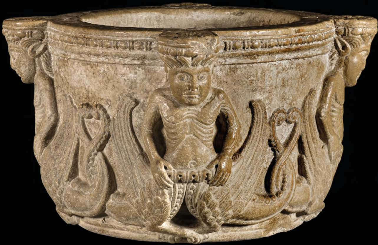
Willigelmo, Pila de agua bendita con imágenes demoníacas, 1107-1115. Museo Diocesano de Cremona.

secciones. La primera abordará el momento de la destrucción y dispersión de la portada en el siglo XIX y el posterior nacimiento de la conciencia patrimonial actual. Un segundo ámbito de la exposición explicará la edad de oro del monasterio medieval a través de sus vínculos con Roma, la creación de relatos legendarios y la realización de una portalada de mármol de la que se ofrecerá una propuesta de reconstrucción. Finalmente, la exposición planteará una reflexión sobre la inspiración antigua del Maestro de Cabestany y el carácter retrospectivo de su arte y su técnica, con la exhibición de otros ejemplos de los siglos XI-XII traídos desde diferentes puntos de Europa que se mostrarán junto a los sarcófagos y relieves romanos.