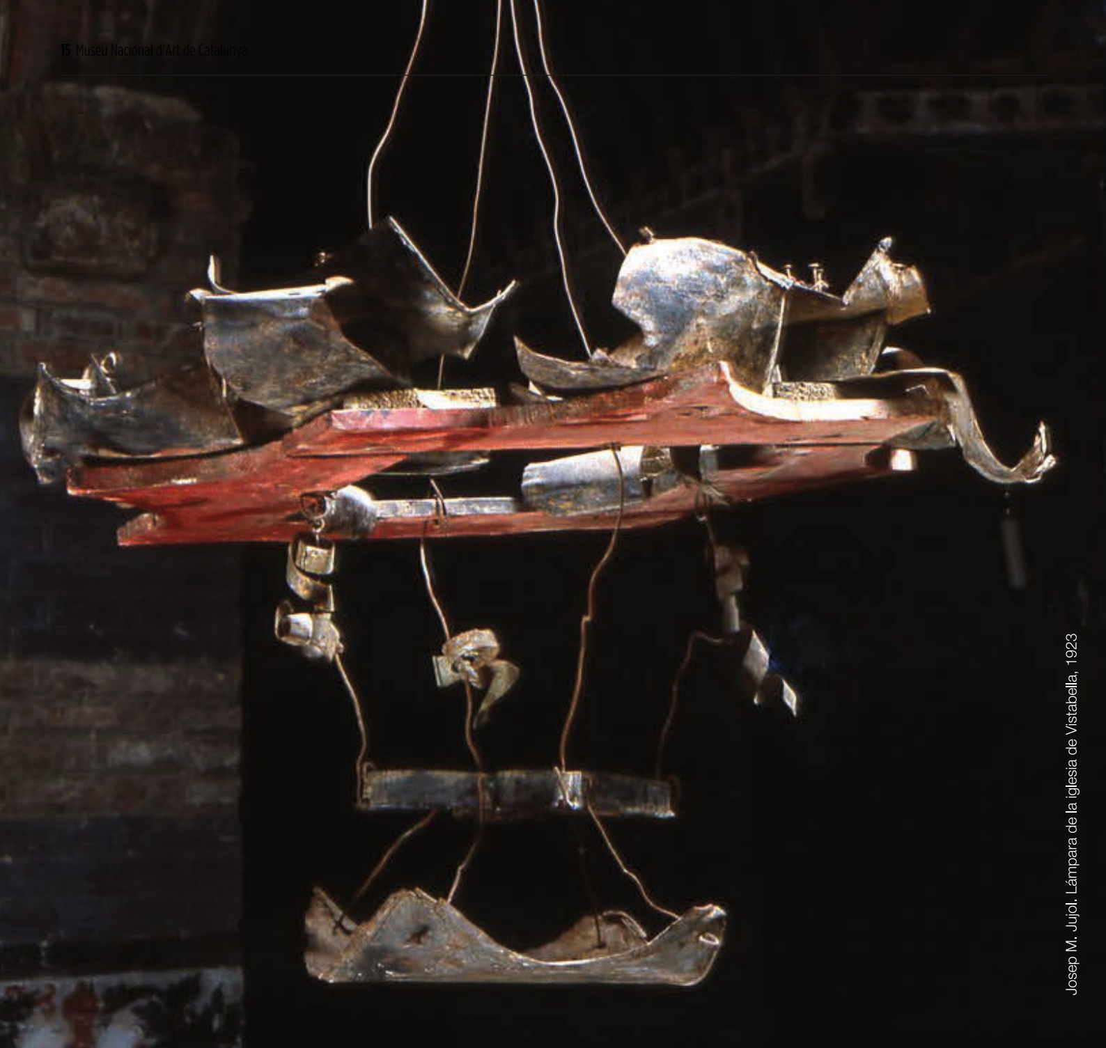
Josep M. Jujol. Lámpara de la iglesia de Vistabella, 1923