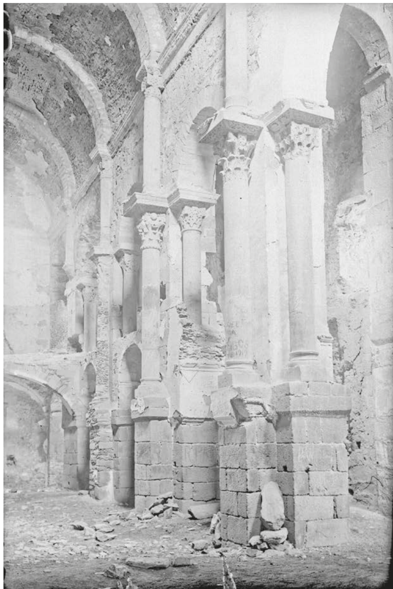
Vista del interior de la iglesia de Sant Pere de Rodés con ruinas en el suelo (1925-1939).

“La exposición es un homenaje al escultor más genial e internacional del románico catalán y una reflexión sobre la inspiración antigua de su arte.”