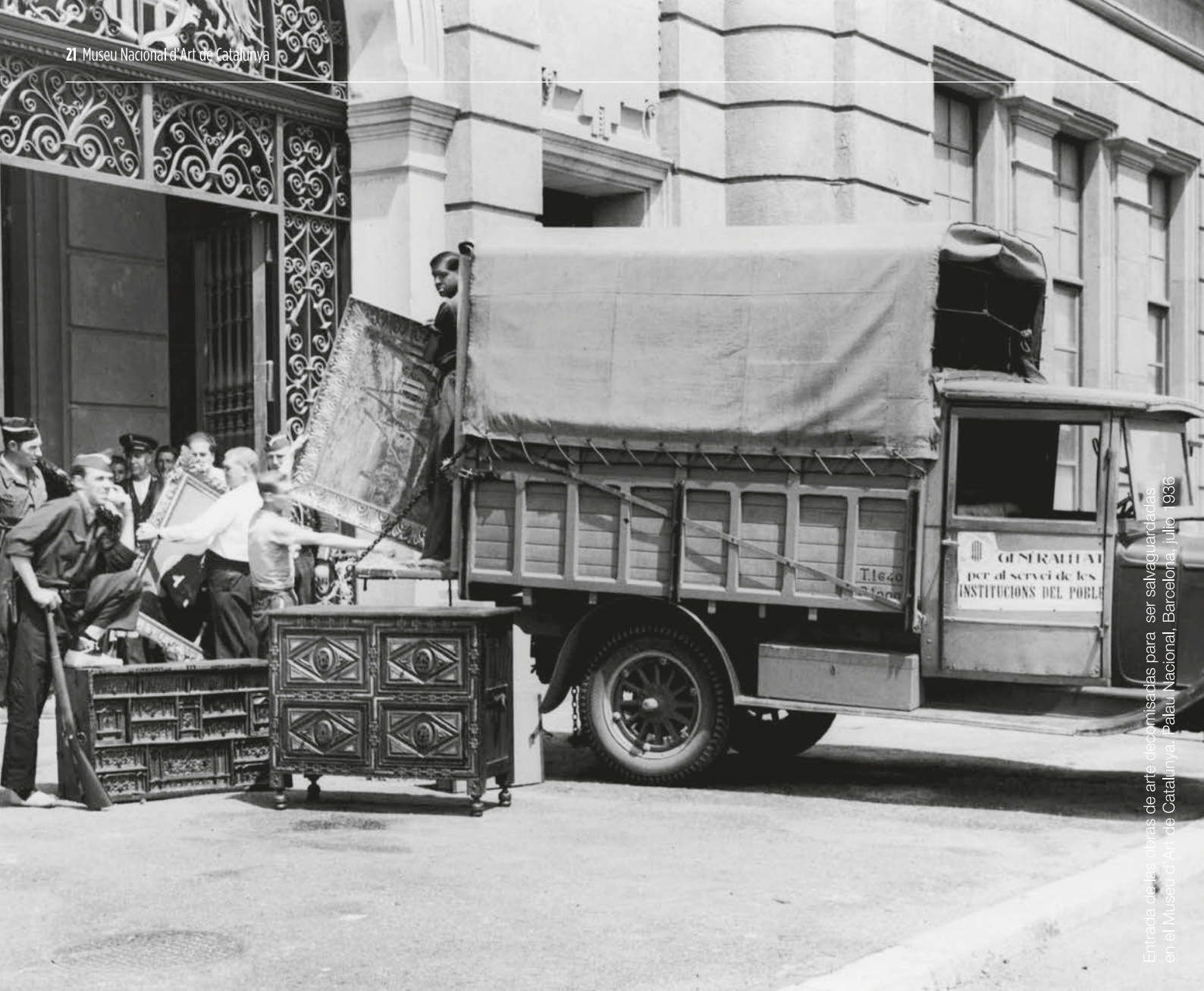
Entrada de les obres d'art decomissades para ser salvaguardades en el Museu d'Art de Catalunya, Palau Nacional, Barcelona, juliol 1936