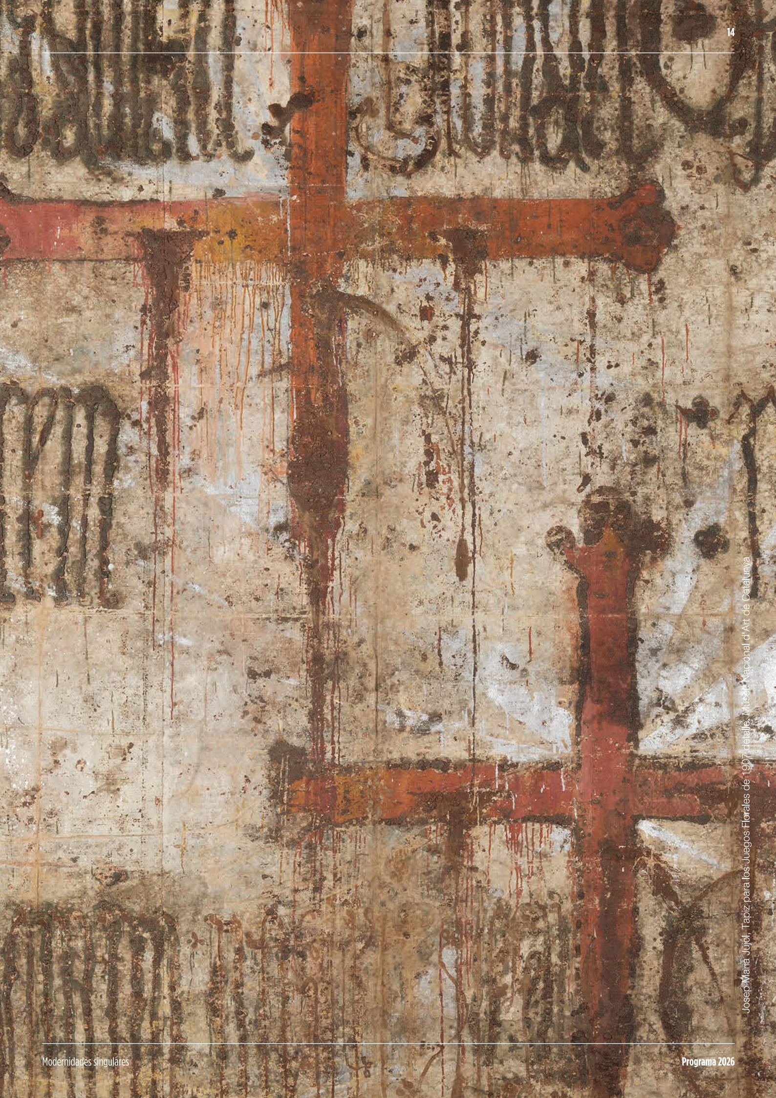
Josep Maria Jujol. Tapiz para los Juegos Florales de 1907, detalle. Museu Nacional d'Art de Catalunya