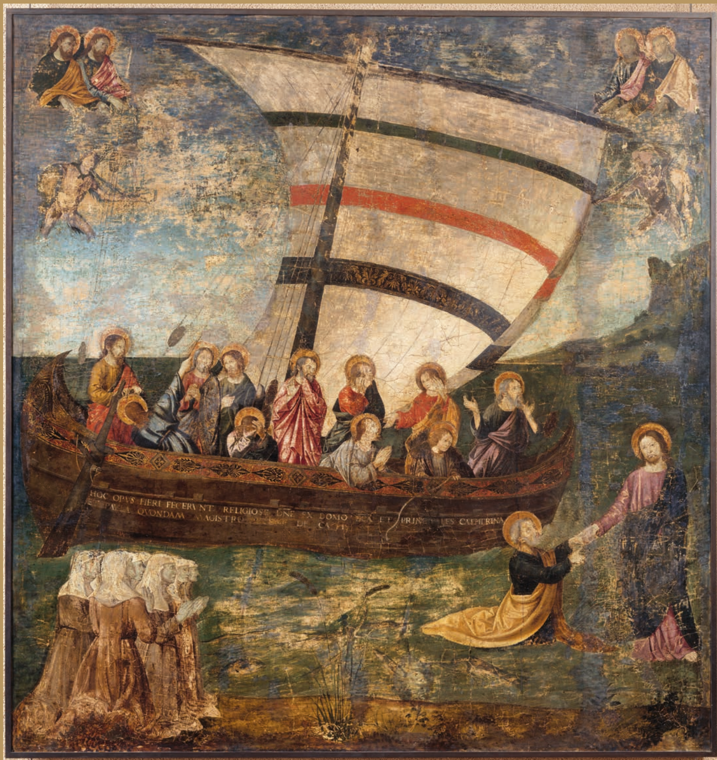
Antoniazio Romano, La Navicella di Giotto, s. XV. Avignon, Musée du Petit Palais.