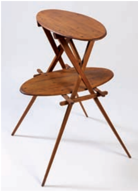
Josep Maria Jujol. Taula ovalada. Fusta.