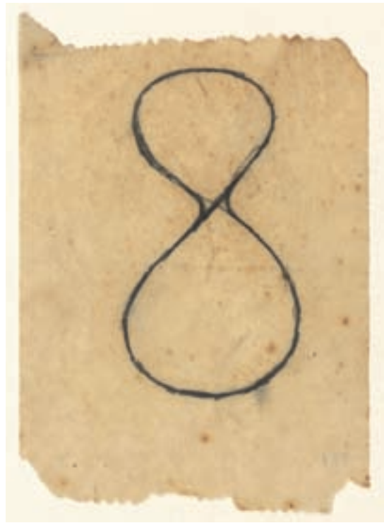
Joan Miró. Sense títol. Anotació.