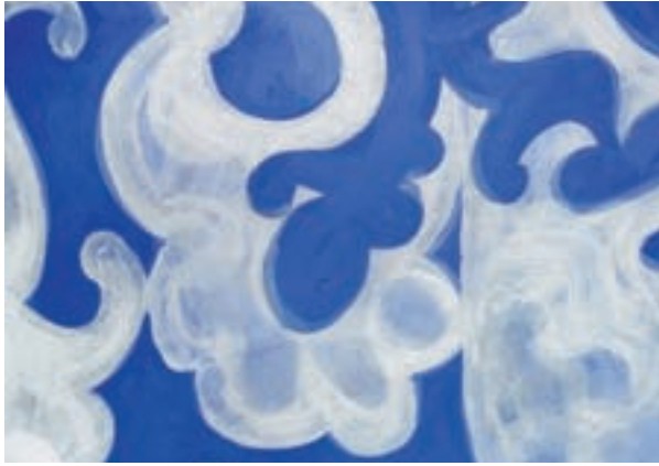
Josep M. Jujol. Can Negre , 1911-1929. Pintura de l'escala, detall. Centre Jujol, Sant Joan Despí.