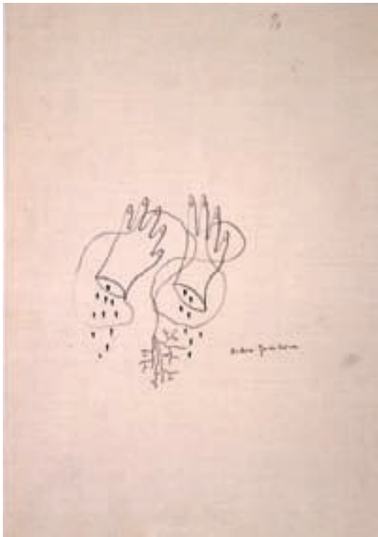
Federico García Lorca. Manos cortadas , 1935-1936.