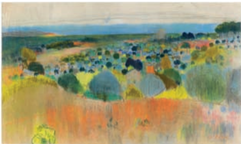
Joaquim Mir. Vista del Camp de Tarragona , 1907-1913. Pastel.