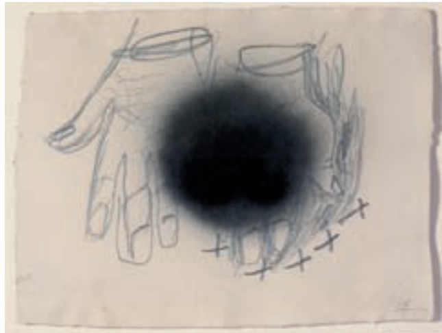
Antoni Tàpies. Mirar la mà, núm. 3 , 1998.

La revisió de la tradició artística del país, i més concretament del barroc, és una de les fites pendents que es planteja el museu. En aquest context, un treball com el de Perejaume en aquesta exposició comença a posar les bases de la revisió que, sobre aquest període, el Museu Nacional farà en un futur.