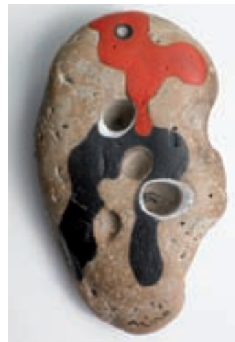
Joan Miró. Pintura sobre pedra , 1934. Oli sobre pedra natural.

La majoria d'aparellaments d'obres que proposem desvetllen el terrarisme, l'autarquia i la civilització pagesa i ciutadana d'un sotacamp pacient que les travessa i les suspesa.