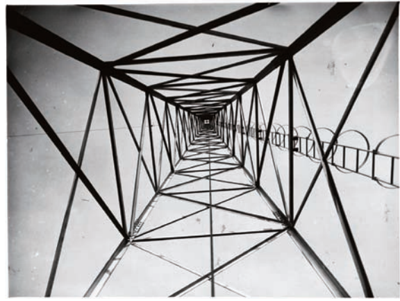
Antena de Ràdio Barcelona al Tibidabo, Barcelona, 1930.