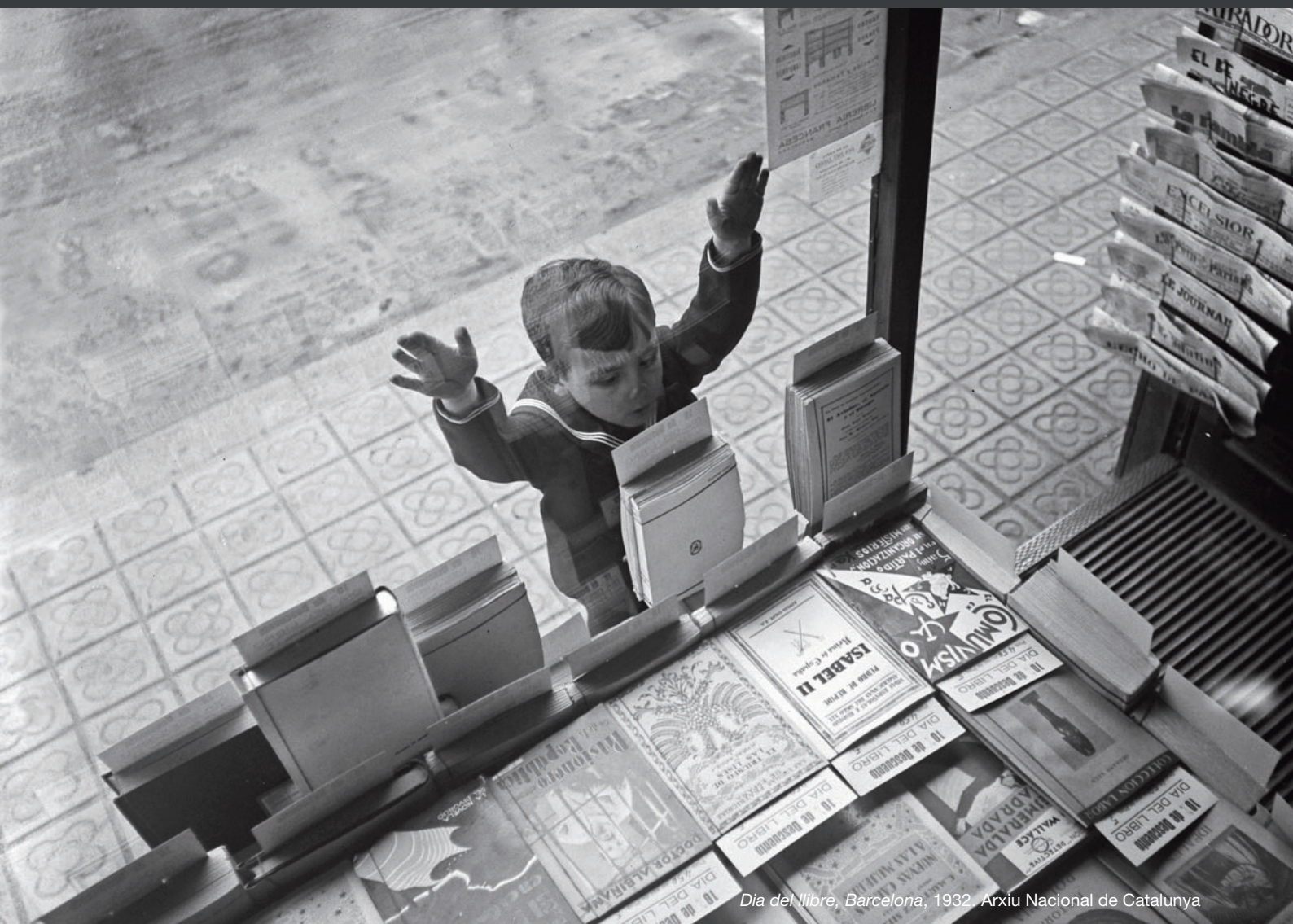
Dia del llibre, Barcelona, 1932. Arxiu Nacional de Catalunya