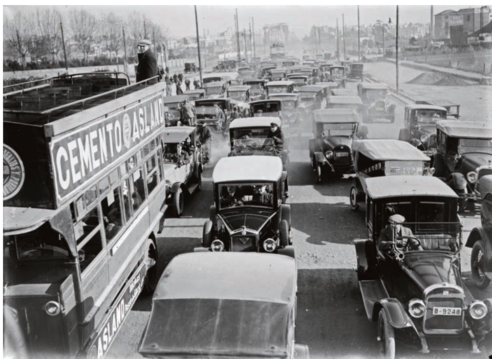
Embús a un carrer de Barcelona, anys 1930.

L'exposició es desplega en 4 àmbits temàtics que connecten Gabriel Casas amb la Nova Fotografia, amb els temes de la modernitat i amb les preocupacions socials i polítiques del seu temps.