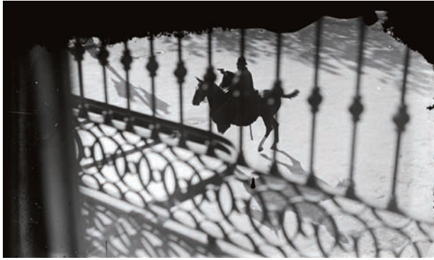
Policia a cavall durant la vaga general, Barcelona, 1930.