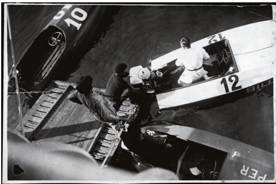
Llanxes de competició, 1930.