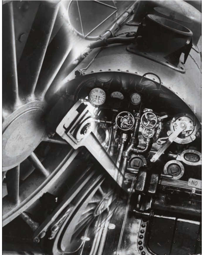
Fotomuntatge publicat a la revista Imatges . Setmanari Gràfic d'Actualitats , 1930. Museu Nacional d'Art de Catalunya

La seva vinculació als cercles de l'avantguarda artística, en els quals la fotografia i el cinema eren molt presents i considerats com les noves tècniques artístiques, el va dur a esdevenir un dels primers fotògrafs professionals espanyols que va utilitzar el llenguatge de la Nova Visió. Va recórrer tant a qüestions estètiques com psicològiques en la realització de les seves fotografies d'informació, a les quals va utilitzar els picats, els contrapicats, el fotomuntatge, els descentraments respecte de l'eix de simetria o les fragmentacions, i va crear un llenguatge que va fugir del de la major part de la producció de l'època a Espanya i que el connecta amb la producció de l'avantguarda artística europea que creadors i teòrics com László Moholy-Nagy van començar a promoure.