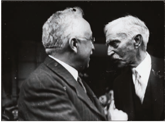
Niceto Alcalá Zamora, president de la República Espanyola, i Francesc Macià, president de la Generalitat de Catalunya, 1931.