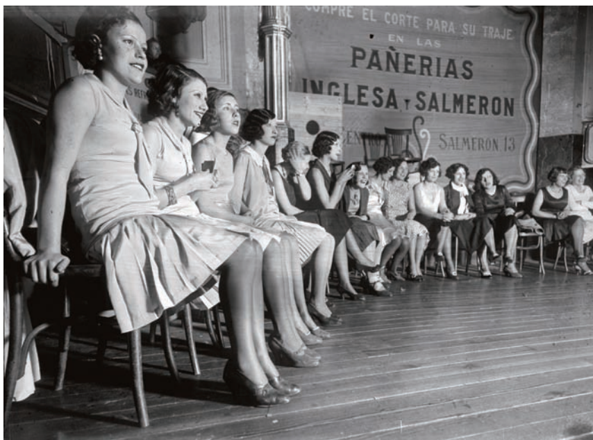
Sala de ball, Barcelona, 1930-1933.