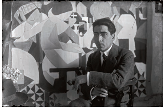
Rafael Barradas, pintor. 1926-1928.