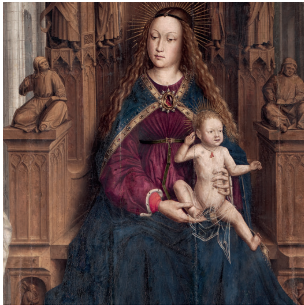
Lluís Dalmau. Mare de Déu dels Consellers . Detall, 1443-1445. Museu Nacional d'Art de Catalunya