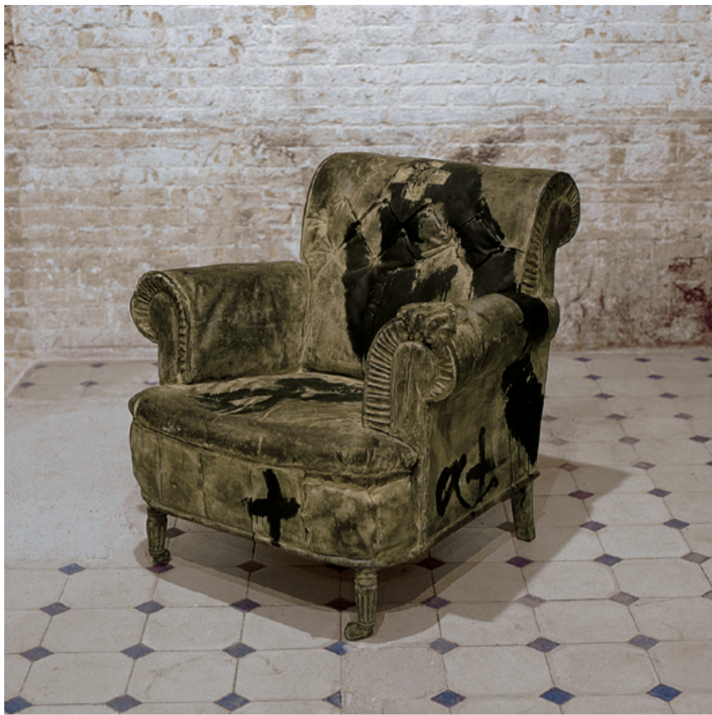
Antoni Tàpies. Butaca . 1987. Col·lecció Suñol Soler