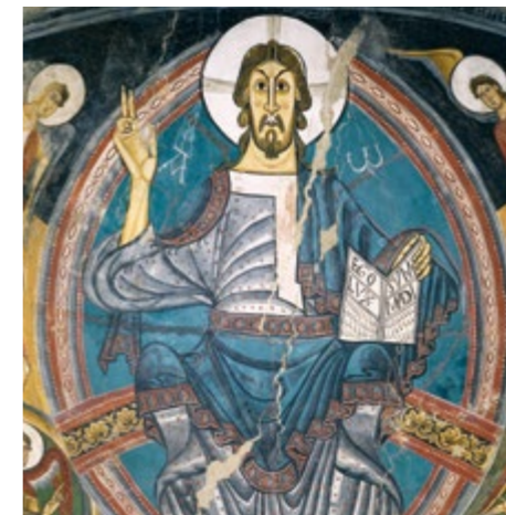
Peintures de Sant Climent de Taüll (détail) Salle 7