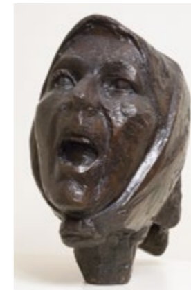
Tête de Montserrat criant - JULI GONZÁLEZ Salle 81