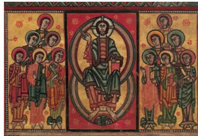
Frontal d'autel de la Seu d'Urgell ou des Apôtres Salle 5