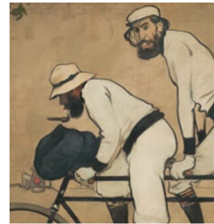
Ramon Casas et Pere Romeu en un tandem (détail) - RAMON CASAS Salle 54