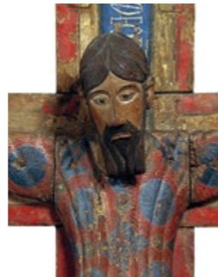
Le Christ en majesté Batlló (détail) Salle 10