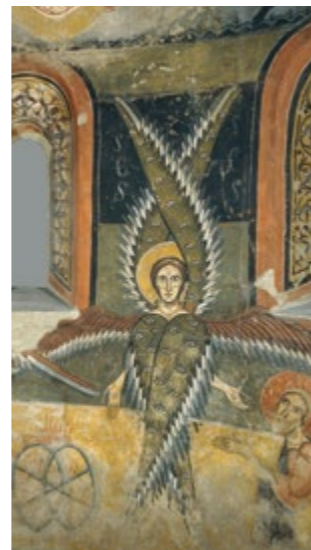
Abside de Santa Maria d'Aneu (détail) Salle 4

Dans certains cas, certaines œuvres peuvent se trouver hors de leur lieu d'exposition habituel.