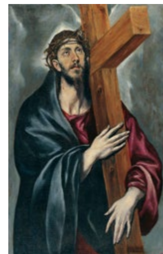
Christ portant la croix - DOMÉNIKOS THEOTOKÓPOULOS (EL GRECO) Salle 32