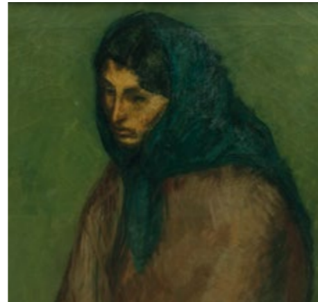
Amparo (détail) - ISIDRE NONELL Salle 63