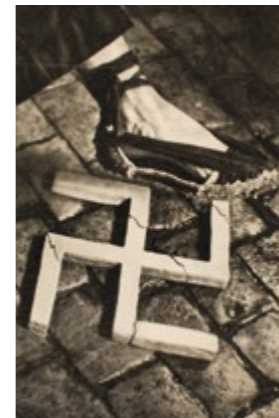
Écrasons le fascisme - PERE CATALÀ PIC Salle 79