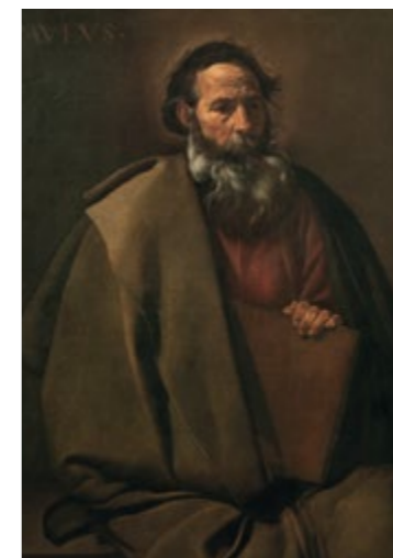
Saint Paul - DIEGO VELÁZQUEZ Salle 34