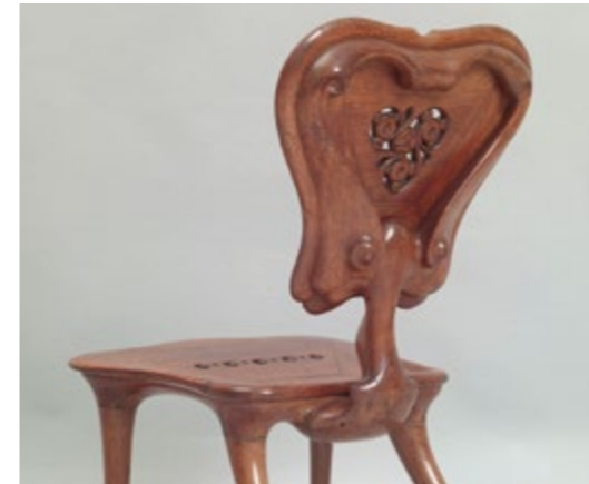
Chaise de la Casa Calvet (détail) - ANTONI GAUDÍ Salle 65