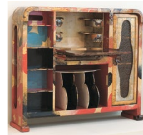
Écritoire et archives de partitions - JOSEP MARIA JUJOL Salle 66