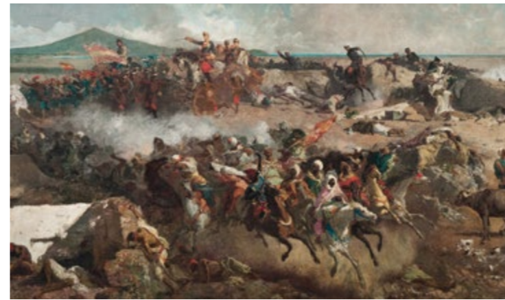
La bataille de Tétouan (détail) - MARIÀ FORTUNY Salle 50