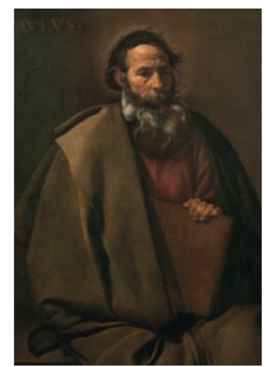
San Pablo - DIEGO VELÁZQUEZ Sala 34

MUSEU NACIONAL D'ART DE CATALUNYA Parc de Montjuïc Barcelona www.museunacional.cat @MuseuNac_Cat