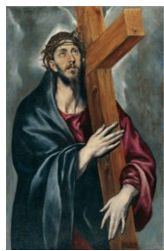
Cristo con la Cruz - DOMÉNIKOS THEOTOKÓPOULOS (EL GRECO) Sala 32