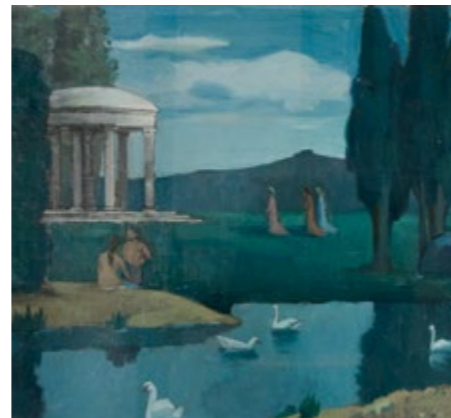
Templo a las ninfas (detalle) - JOAQUIM TORRES-GARCÍA Sala 70