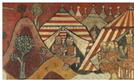
Pinturas murales de la conquista de Mallorca (detalle) - MAESTRO DE LA CONQUISTA DE MALLORCA Sala 17