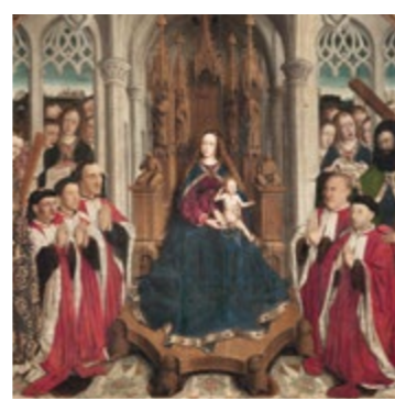
Virgen de los «Consellers» (detalle) - LLUÍS DALMAU Sala 26