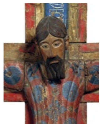
Majestad Batlló (detalle) Sala 10