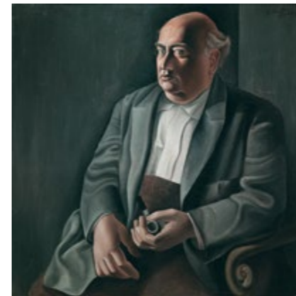
Retrato de mi padre - SALVADOR DALÍ Sala 72