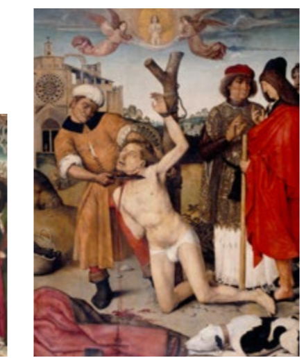
Martirio de san Cucufate - AYNE BRU Sala 28