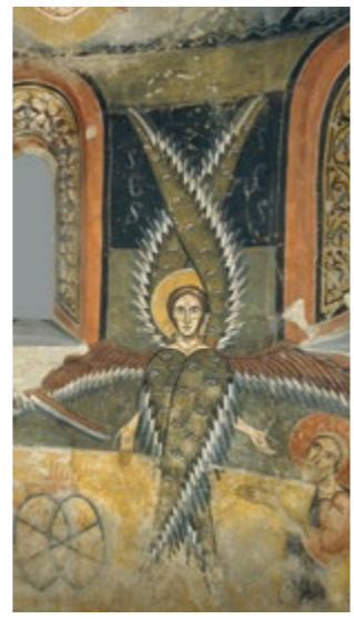
Ábside de Santa Maria de Àneu (detalle) Sala 4

Audioguía en catalán, castellano, inglés, francés, ruso, italiano y japonés. Zonas Wi-Fi: Vestíbulo, Sala Oval, Salas de exposiciones temporales, Auditorios, Biblioteca, Sala de la Cúpula, Cafetería y Restaurante. Eventualmente, alguna de las obras puede encontrarse fuera de su localización habitual.