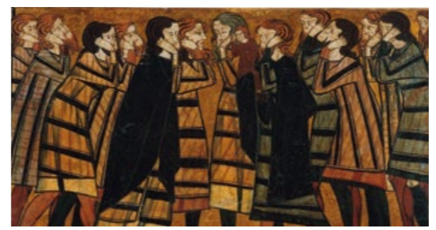
Tablas de la tumba del caballero Sancho Sánchez Carrillo. Plaïdidos (detalle) Sala 19