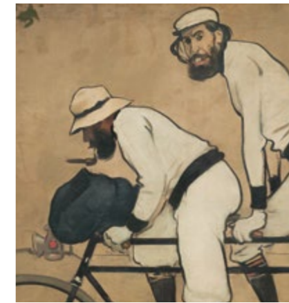
Ramon Casas y Pere Romeu en un tàndem (detalle) - RAMON CASAS Sala 54