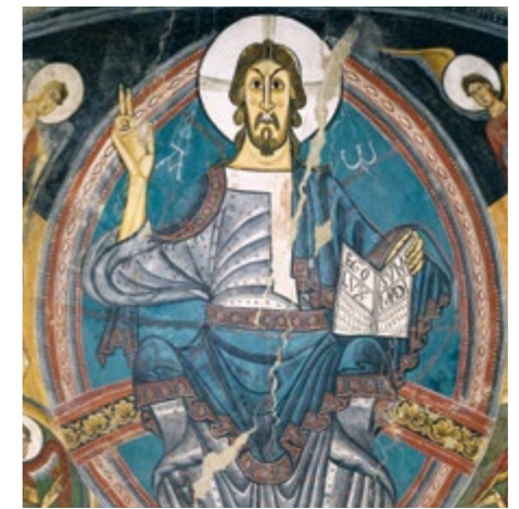
Pinturas de Sant Climent de Taüll (detalle) Sala 7