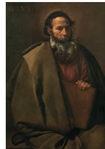
Sant Pau - DIEGO VELÁZQUEZ Sala 34

MUSEU NACIONAL D'ART DE CATALUNYA Parc de Montjuïc Barcelona www.museunacional.cat