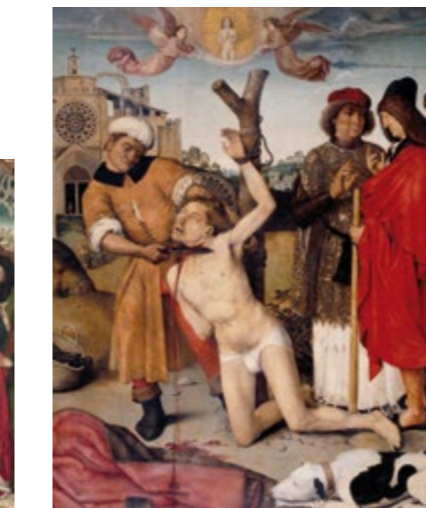
Martiri de sant Cugat - AYNE BRU Sala 28