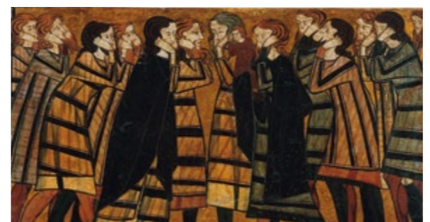
Tablas de la tumba del caballero Sancho Sánchez Carrillo. Plañideros (detalle) Sala 19