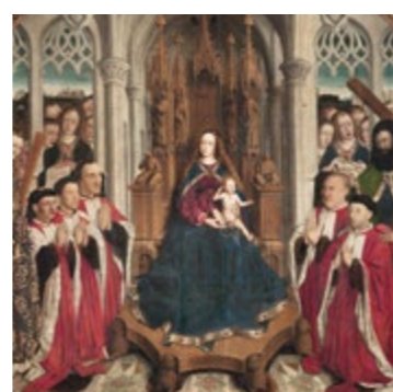
Virgen de los «Consellers» (detalle) - LLUÍS DALMAU Sala 26