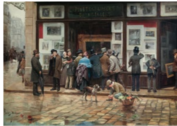
Exposición pública de un cuadro - JOAN FERRER MIRÓ Sala 43

Zonas Wi-Fi: Vestíbulo, Sala Oval, Salas de exposiciones temporales, Auditorios, Biblioteca, Sala de la Cúpula, Cafetería y Restaurante.