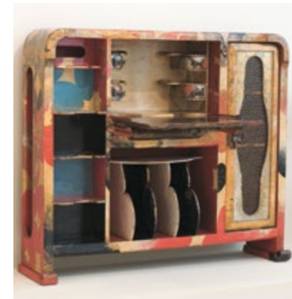
Escritorio archivador de partituras - JOSEP MARIA JUJOL Sala 66