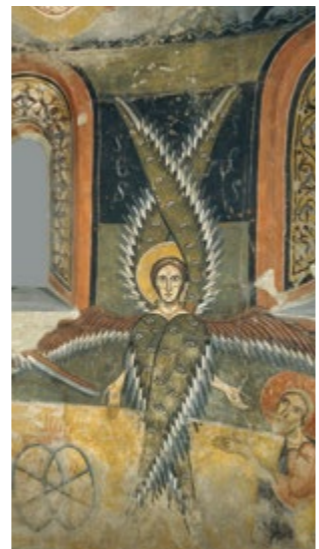
Ábside de Santa Maria de Àneu (detalle) Sala 4

Audioguía en catalán, castellano, inglés, francés, italiano, alemán, ruso, japonés y chino. Zonas Wi-Fi: Vestíbulo, Sala Oval, Salas de exposiciones temporales, Auditorios, Biblioteca, Sala de la Cúpula, Cafetería y Restaurante.