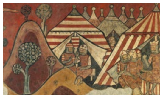
Pinturas murales de la conquista de Mallorca (detalle) - MAESTRO DE LA CONQUISTA DE MALLORCA Sala 17