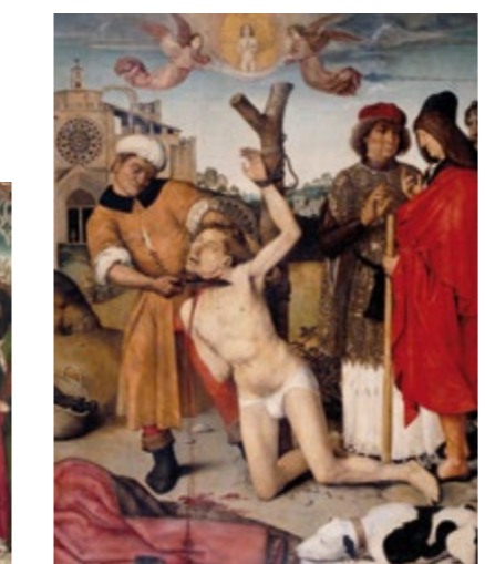
Martirio de san Cucufate - AYNE BRU Sala 28