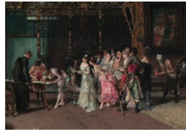
La vicaria (detalle) - MARIÀ FORTUNY Sala 50