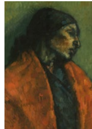
Paloma (détail) - ISIDRE NONELL Salle 63