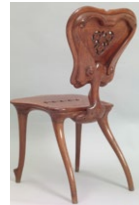
Chaise de la Casa Calvet - ANTONI GAUDÍ Salle 65