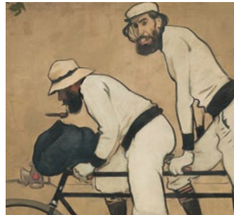
Ramon Casas i Pere Romeu en un tàndem (detall) - RAMON CASAS Sala 54