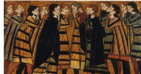
Taulas de la tomba del cavaller Sancho Sánchez Carrillo. Ploroners (detall) Sala 19