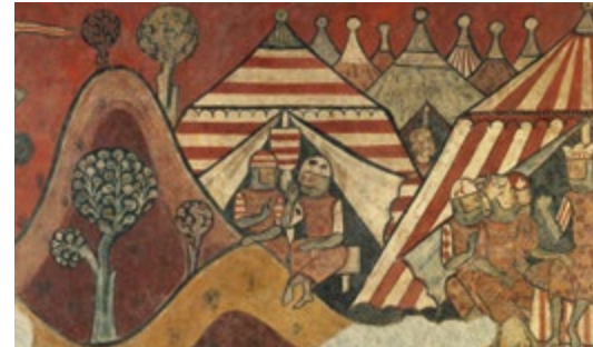
Pintures murals de la conquesta de Mallorca (detall) - MESTRE DE LA CONQUESTA DE MALLORCA Sala 17