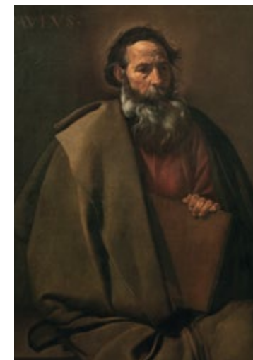
Sant Pau - DIEGO VELÁZQUEZ Sala 34