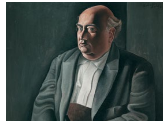
Retrat del meu pare (detall) - SALVADOR DALÍ Sala 73