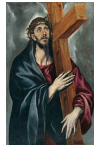
Crist amb la Creu - DOMÈNIKOS THEOTOKÓPOULOS (EL GRECO) Sala 32