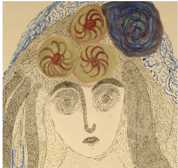
La gran Teósofa. Museo Nacional del Prado