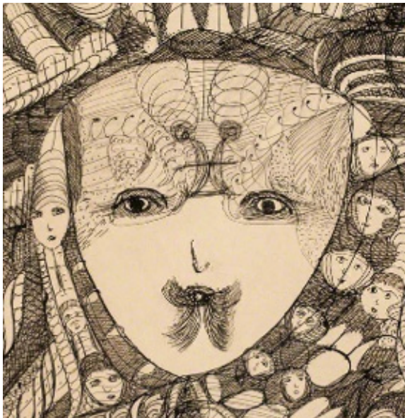
Madge Gill. London Borough of Newham

Actualmente las obras de estas artistas visionarias abandonan la marginalidad patrimonial para ocupar espacio y lecturas en importantes museos de arte moderno y contemporáneo, como el Museo del Prado, el Macba, el Georges Pompidou o el Albertina.