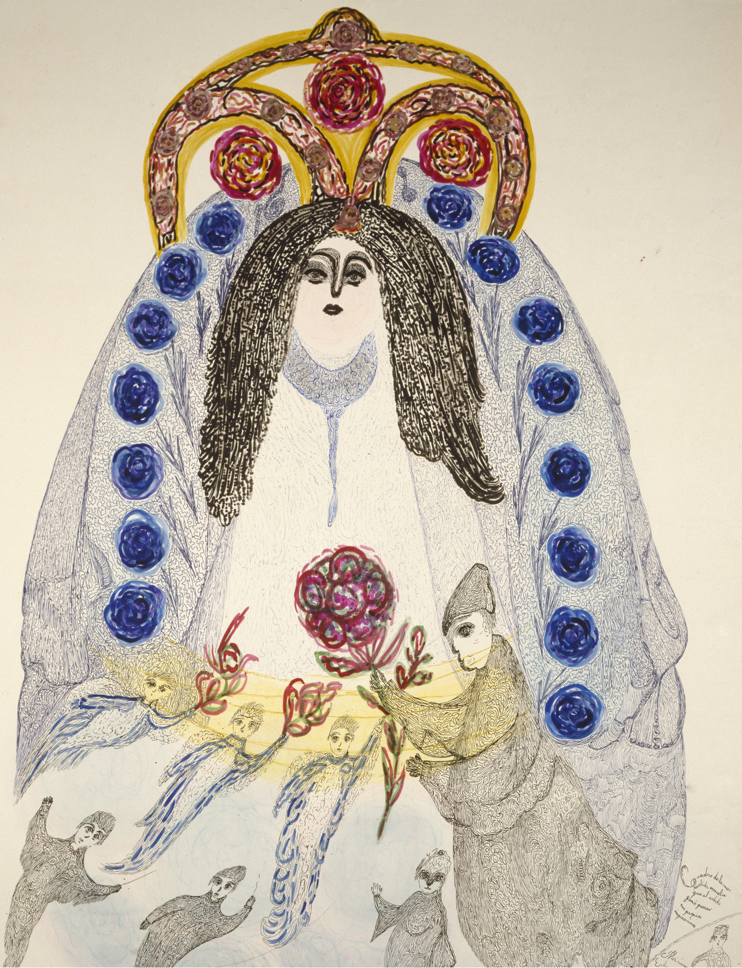
Josefa Tolrà. Museo Nacional del Prado