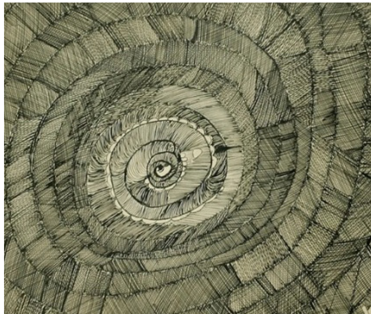
Josefa Tolrà. Genio (fragmento). Museo Nacional del Prado