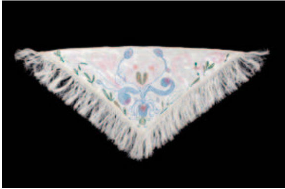
Josefa Tolrà. Mocado blanc brodat A , 1956.