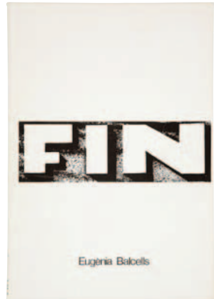
Eugènia Balcells. Fin , 1977. Museu d'Art Contemporani Barcelona (MACBA)

Se aprecia un notable incremento de los espacios expositivos, sobre todo las galerías (Joan Prats, Ciento, Mec Mec, Trece, G, Sala Aixelà, Eude, 49, Maeght, Galería Cadaqués, etc). La Sala Trece en Sabadell y, sobre todo, la Sala Vinçon, un verdadero meeting point para la época, certifican la actividad artística de estos años que son, también, los de la aparición de diversas revistas contraculturales como Ajoblanco , El Rollo enmascarado y Star ; de humor satírico, por ejemplo El Jueves y Por Favor ; o de pensamiento político, como El Viejo Topo . La editorial Gustavo Gili, con sus colecciones sobre diseño y arquitectura, ocupa un lugar destacado, así como CAU y Carrer de la Ciutat . Llibres del Mall testimonia la importancia de la actividad poética a lo largo de este período.