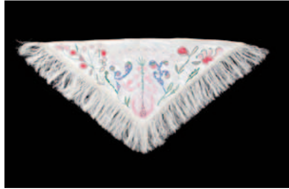
Josefa Tolrà. Mocado blanc brodat B