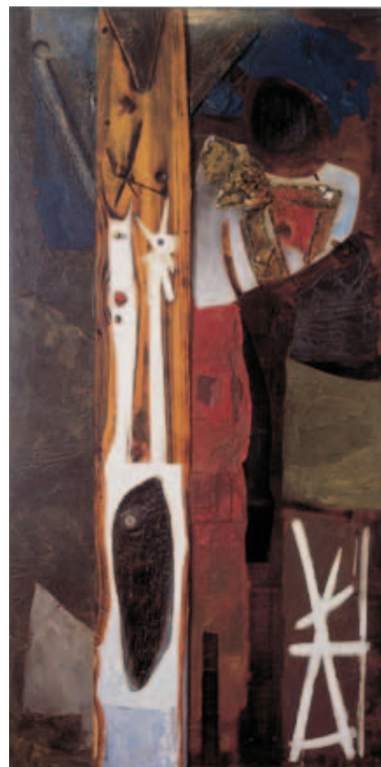
Josep Guinovart. L'arbre , 1958. Museu d'Art Contemporani de Barcelona (MACBA)

En este sentido, la muestra se complementa y prolonga cronológicamente la nueva presentación de arte moderno de la colección del Museu Nacional y prefigura una posible exposición permanente desplegada hasta finales de la década de los setenta, aunque señalando, también, visiones monográficas futuras, así como los fondos documentales del museo.