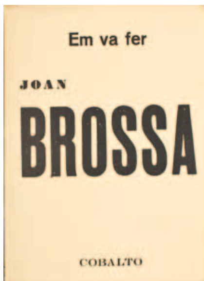
Joan Brossa, Joan Ponç, Joao Cabral. Em va fer Joan Brossa , 1951. Museu d'Art Contemporani de Barcelona (MACBA)