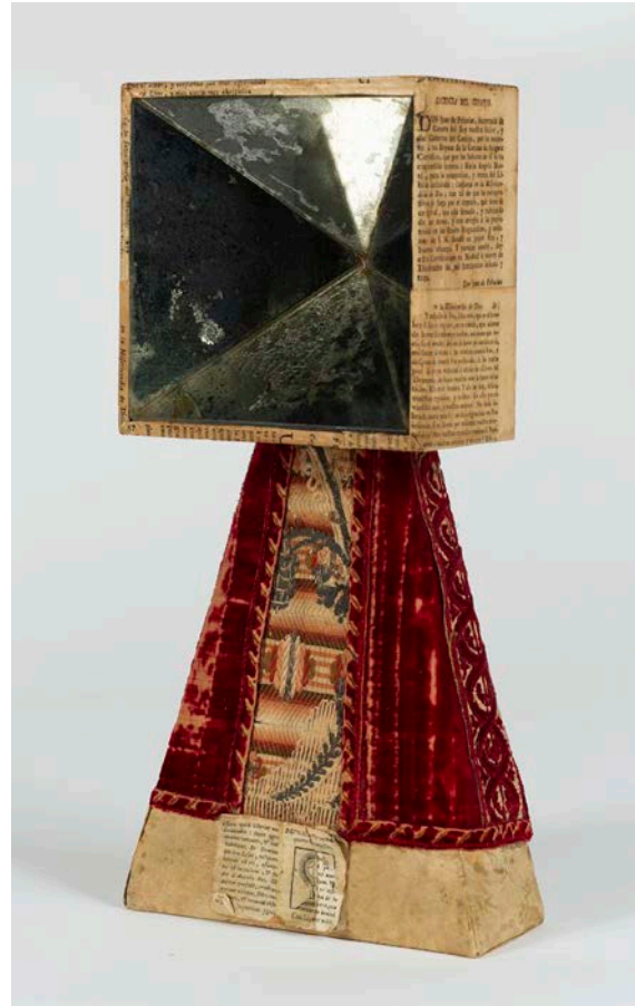
Aurèlia Muñoz. Isabel la Catòlica , 1967. Museu Nacional d'Art de Catalunya, donació dels hereus d'Aurèlia Muñoz, 2019. © Hereus d'Aurèlia Muñoz