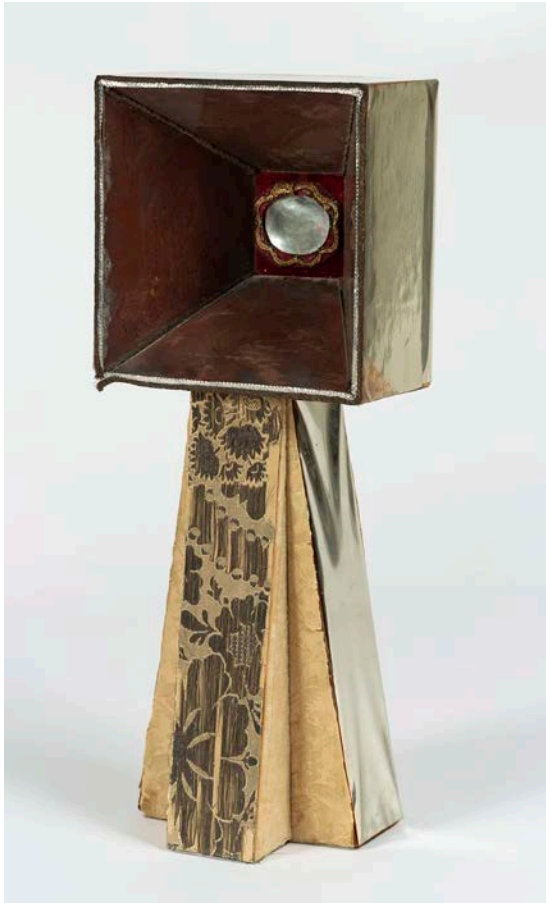
Aurèlia Muñoz. Ferran el Catòlic , 1967. Museu Nacional d'Art de Catalunya, donació dels hereus d'Aurèlia Muñoz, 2019. © Hereus d'Aurèlia Muñoz