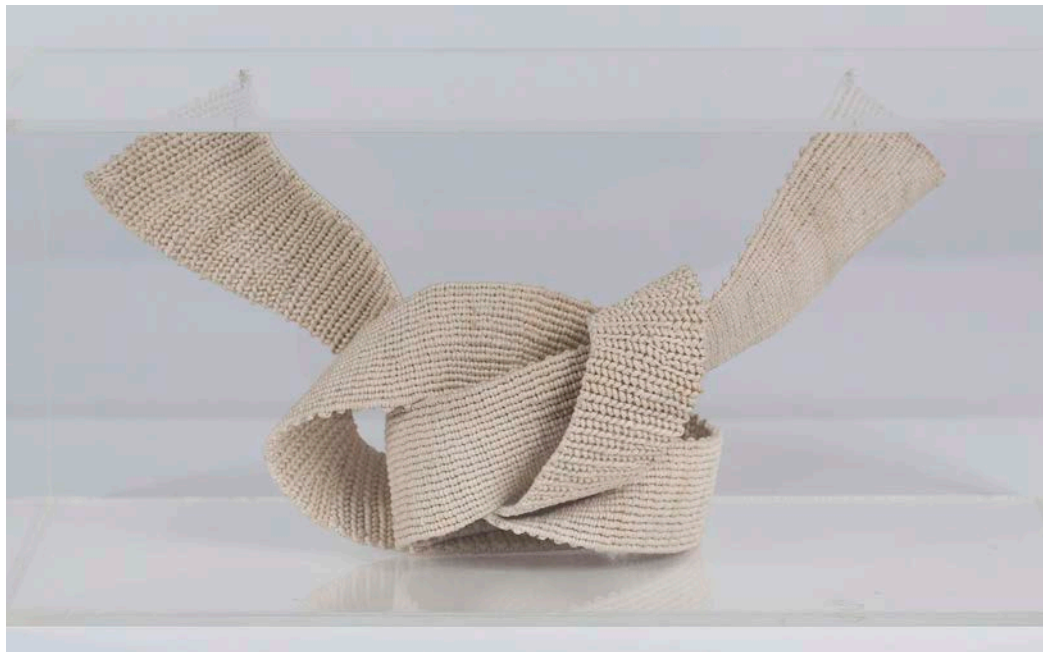
Aurèlia Muñoz. Nudo , 1978. Museu Nacional d'Art de Catalunya, donación de los herederos de Aurèlia Muñoz, 2019. © Herederos de Aurèlia Muñoz

Aurèlia Muñoz (Barcelona, 1926-2011) fue una de las representantes más destacadas del movimiento internacional de la “nueva tapicería” que surgió a mediados de los años sesenta del siglo pasado. Aquí presentamos un conjunto de obras generosamente donadas por la familia de la artista que se incorporan a la colección del museo. Collage , tapiz, dibujo, escultura; los procedimientos y los materiales son diversos a lo largo de la trayectoria de la artista, pero quizás lo más importante sea lo menos tangible: el espacio, el ritmo y la evocación simbólica. La artista combina las texturas densas y sensuales con las calidades aéreas. La flexibilidad y la morbidez se ligan con la tensión y la estructura, ofreciendo una evocación de la naturaleza entendida como un sistema dinámico y misterioso que nos remite, así, a las preguntas que la física contemporánea está planteando. Su obra, eminentemente experimental, adquiere hoy un sentido y una relevancia nuevos.