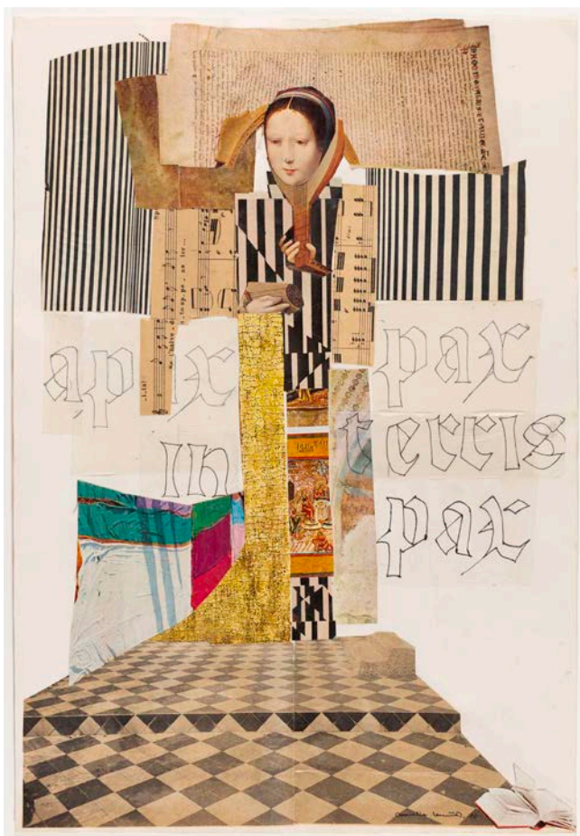
Aurèlia Muñoz. Sin título , 1970. Museu Nacional d'Art de Catalunya, donación de los herederos de Aurèlia Muñoz, 2019. © Herederos de Aurèlia Muñoz

A lo largo de su dilatada carrera, Aurèlia Muñoz (Barcelona 1926-2011) recibió el reconocimiento de la crítica. Fue especialmente celebrada en el campo de las artes del tapiz y el arte textil, que tuvieron un gran desarrollo en los años sesenta y setenta del siglo pasado, con la Bienal de Lausana como acontecimiento aglutinante.