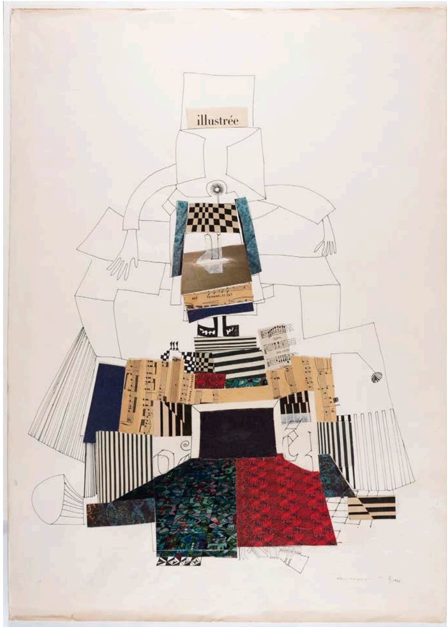
Aurèlia Muñoz. Sin título , 1966. Museu Nacional d'Art de Catalunya, donación de los herederos de Aurèlia Muñoz, 2019. © Herederos de Aurèlia Muñoz