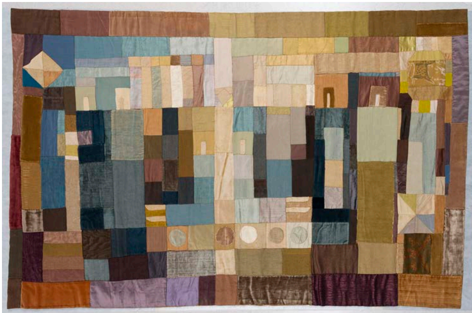
Aurèlia Muñoz. Personajes místicos y cruz , 1964. Museu Nacional d'Art de Catalunya, donación de los herederos de Aurèlia Muñoz, 2019. © Herederos de Aurèlia Muñoz

En la década de 1970 trabaja con el macramé o técnica del anudado y explora el volumen y el espacio, combinando obra de pequeño y gran formato, cada vez más cerca de la instalación. La naturaleza se convierte en el centro de su poética. En 1982 presenta una gran instalación en el Palacio de Cristal del Parque del Retiro de Madrid. Trabaja con lonas suspendidas, evocando veleros y pájaros. A partir de la década de los noventa se centra en el papel y realiza móviles de carácter constructivista.