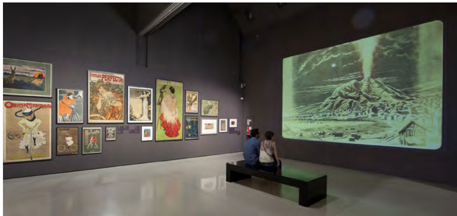
Sala 54 d'art modern

Ja fa temps que el cinema va entrar a les sales del Museu, gràcies a la col·laboració de la Filmoteca de Catalunya i el seu Centre de Conservació i Restauració.