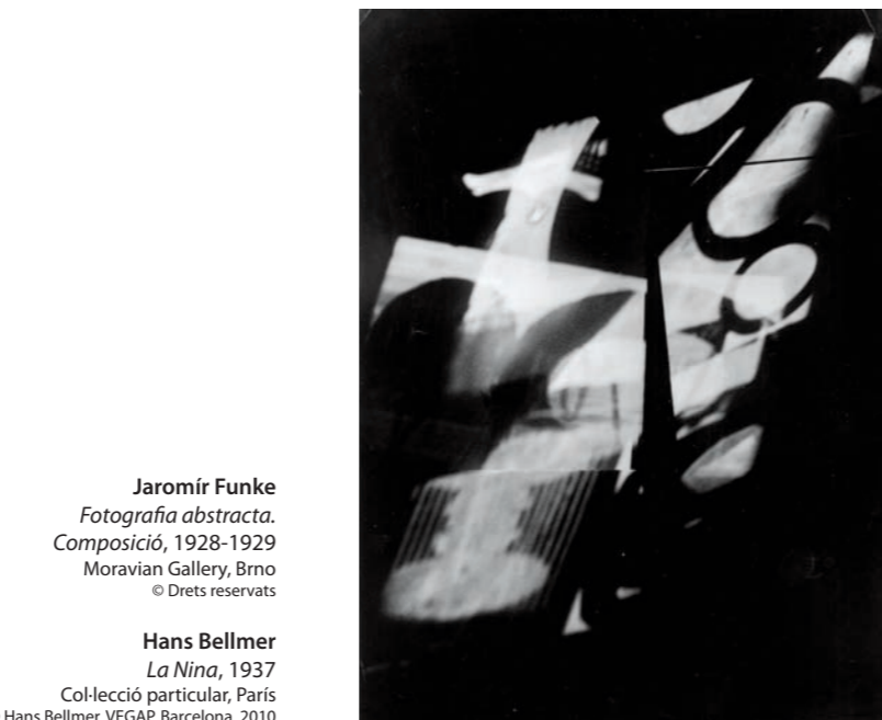
Jaromír Funke Fotografia abstracta. Composició, 1928-1929 Moravian Gallery, Brno