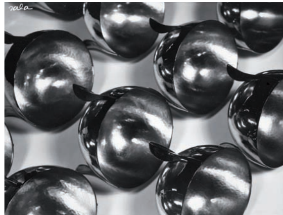
Josep Sala Fotografía publicitaria, 1930 Museu Nacional d'Art de Catalunya

Las relaciones entre Praga y París han sido mostradas y estudiadas en varias ocasiones. Esta exposición quiere dar a conocer la aportación de los autores catalanes. El MNAC propone, de este modo, una relectura que contribuya a situar a la fotografía catalana de vanguardia en el lugar que se merece en el contexto internacional.